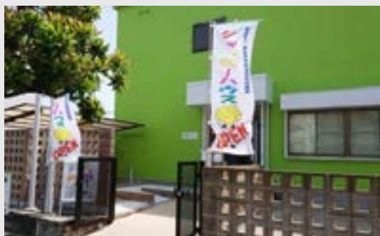
シャッピーハウス