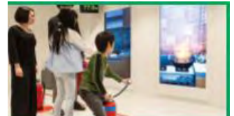
④消火器で火を消す練習