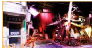
⑥地震でこわれた町