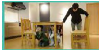
③地震の後逃げる前にやること